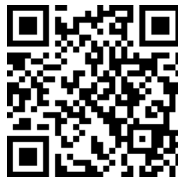
Gambar 2. Kode QR untuk Mengakses E-booklet

E-booklet memiliki kelebihan sebagai media pembelajaran yang efisien dan fleksibel untuk digunakan dimana dan kapanpun. Media ini dapat digunakan menggunakan jaringan internet, sehingga dapat membantu siswa dalam mempelajari materi secara mandiri. Selain itu, e-booklet dilengkapi dengan menu-menu seperti menu materi, video pembelajaran, soal keterampilan berpikir kritis. Menu-menu yang terdapat di dalam e-booklet terdapat informasi menu capaian pembelajaran yang disesuaikan dengan materi QR e-booklet disajikan dalam Gambar 2 dengan link https://heyzine.com/flip-book/f5d815541a.html