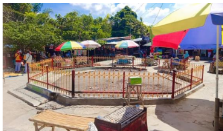
Gambar 2. Lokasi Wisata Api Tak Kunjung Padam (Sumber: Dokumentasi pribadi)

sebelumnya di lokasi, sehingga menurut penduduk setempat Api Tak Kunjung Padam memang murni muncul dari bekas tancapan tongkat Kyai Moko. Adapun foto Api Tak Kunjung Padam dapat dilihat pada Gambar 2.